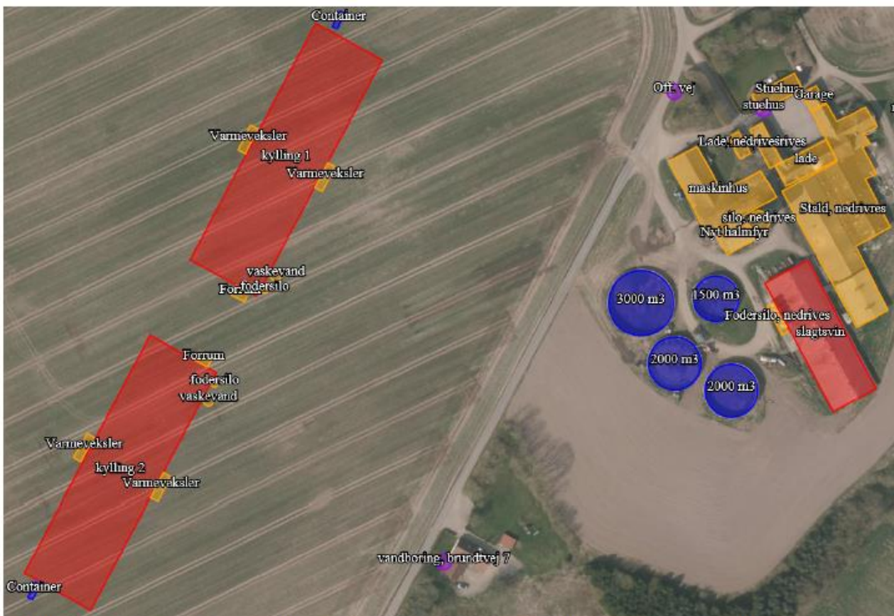
Situationsplan for husdyrbruget Brundtvej 5. De to nye kyllingestalde til venstre og de gamle svinestalde som tages ud af drift til højre. De nuværende og kommende stalde er vist med rød farve.